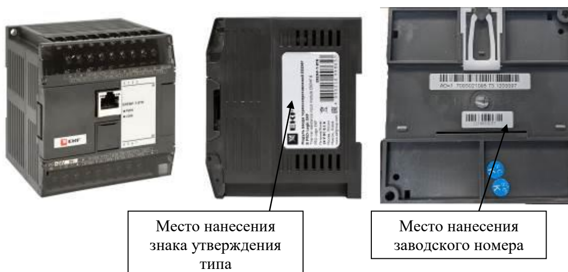
Рисунок 6 – Общий вид модулей расширения EREMF с указанием места нанесения знака утверждения типа и заводского номера