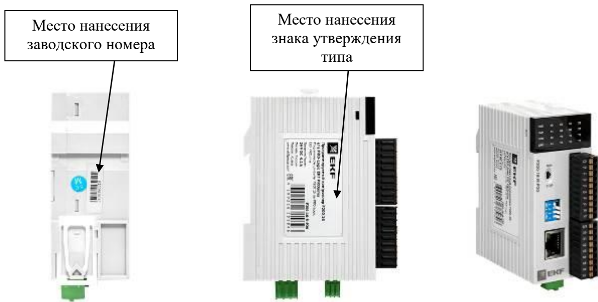
Рисунок 3 – Общий вид процессорных модулей F100 и F200 с указанием места нанесения знака утверждения типа и заводского номера