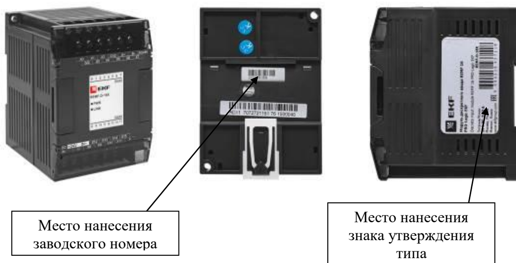
Рисунок 5 – Общий вид модулей расширения REMF с указанием места нанесения знака утверждения типа и заводского номера